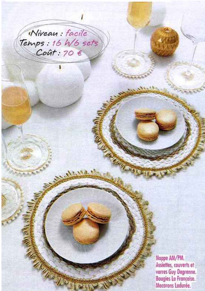
Nappe AM/PM. Assiettes, couverts et verres Guy Degrenne. Bougies La Française. Macarons Ladurée.